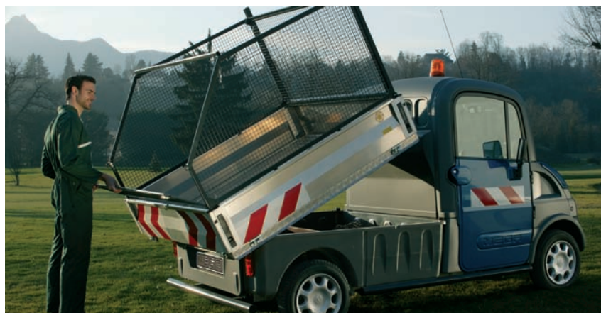
Rasterkooi / stootstangen / zwaailicht